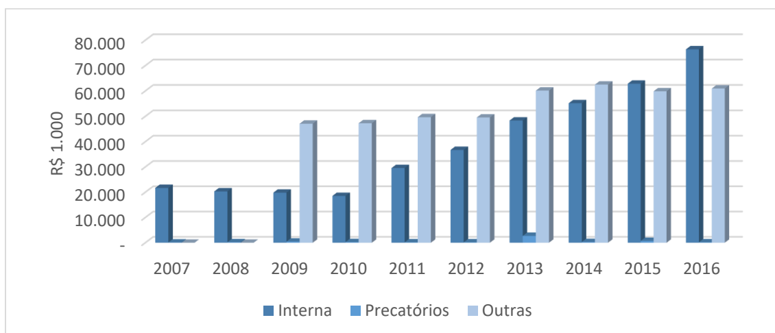
Gráfico 1: Dívida Pública Consolidada 2007-2016

Fonte: Superintendência Orçamento e Modernização Administrativa da Secretaria Municipal de Finanças